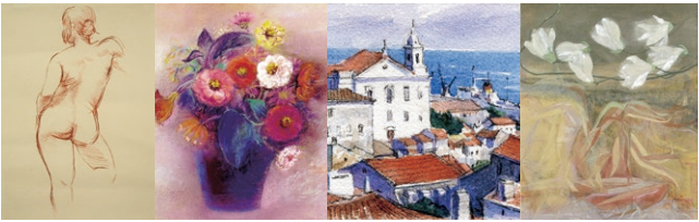
●形類が異なる人物・体デッサン ●やさしいパステル・透明水彩画 ●スケッチをはじめよう ●これからはじめる日本画