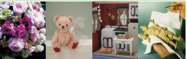
●花まゆ ●くまのおかあさんのティディバ ●ミニチュア・ドールハウス ●仏像彫刻