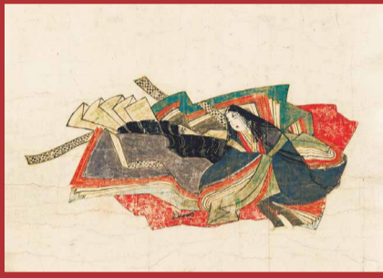
重要文化財 佐竹本三十六歌仙絵 小大君(部分) 奈良・大和文庫館 (後期展示:11月6日~11月24日)

京都国立博物館研究員 井並 林太郎 100年前、秋田藩主佐竹家の至宝「三十六歌仙絵」が切断され、その後、数奇な運命をたどる。財界人を魅了した歌仙絵の魅力をつぶし紹介! ■10/18(金) 10:30~12:00 ■(会員)3,322円 (一般)3,894円 特別展「流転100年 佐竹本三十六歌仙絵と王朝の美」 会期:10月12日(土)~11月24日(日) 会場:京都国立博物館